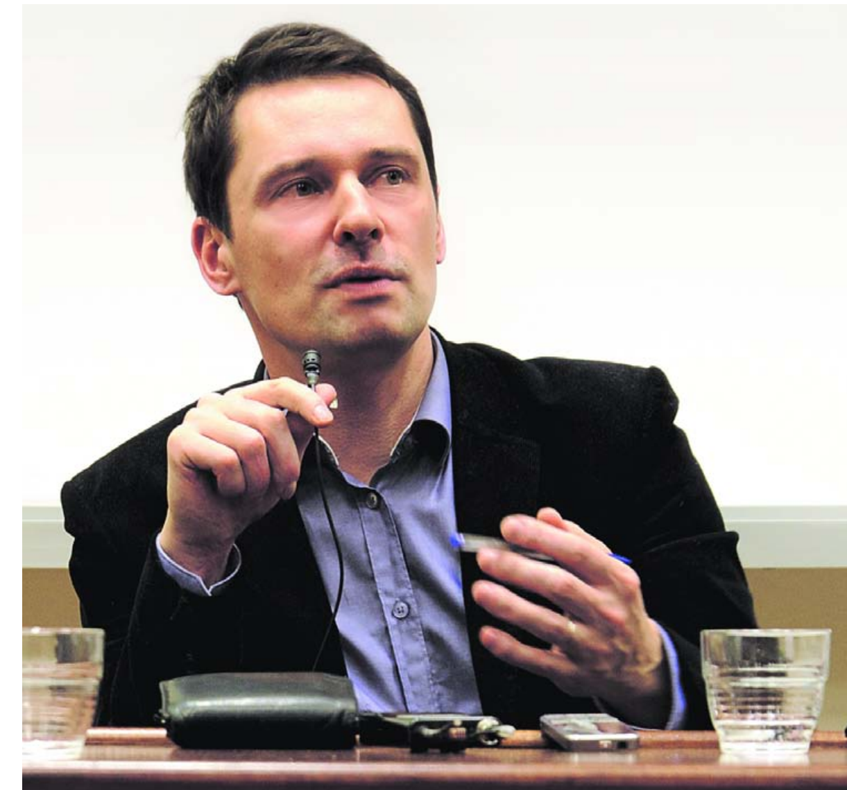
Krzysztof Ziemięć, dziennikarz, prowadzący Wiadomości TVP1

Słuszna uwaga. Być może jestem zbyt skoncentrowany